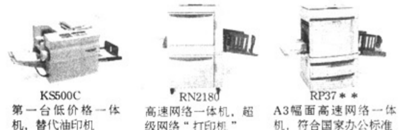
KS500C 第一台低价格一体机,替代油印机 RN2180 高速网络一体机,超高级网络“打印机” RP37** A3幅面高速网络一体机,符合国家办公标准