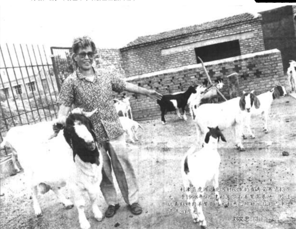
本版编辑 燕艳 本版校对 宋卫国

做大海洋捕捞文章,该县大力实施“海捕结构调整工程”,大力发展海外捕捞生产,通过招商引资新建一对450马力的远洋捕捞船,使大马力捕捞船增加到了3对,目前均在黄渤海作业,获得了较好的经济效益。其它6马力至50马力的渔船有580多艘,集中在近海的莱州湾作业,上半年预计完成海捕产量15000吨。(王文元)